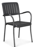
ANTRACITE vern. antracite 61052.02.000

PT Cadeira com braços. Polipropileno com tratamento anti-UV colorido na totalidade. Pernas em alumínio pintado. Acabamento fosco. Com pés antiderrapantes. Resina reciclável.