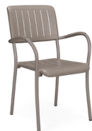
TORTORA vern. tortora 61059.10.000